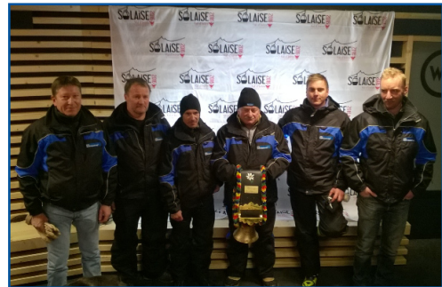
L'équipe Doppelmayr France