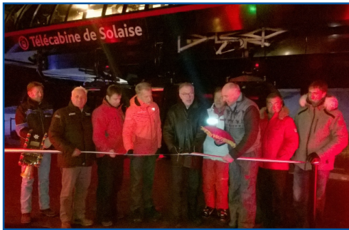
Inauguration le 15 Décembre 2016 - Val d'Isère